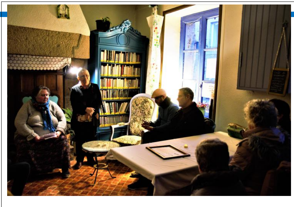
Nuit de la lecture.....