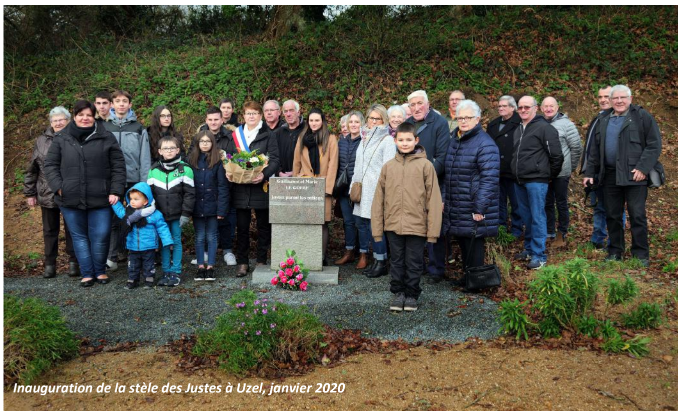
Inauguration de la stèle des Justes à Uzel, janvier 2020